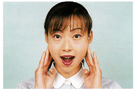
舌を吸いつけて舌小帯を伸ばし“ボン”と音を立てる