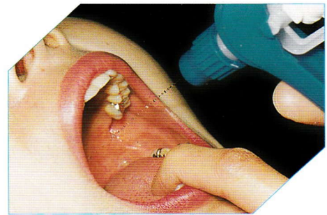
軟口蓋の方へ水を注入する