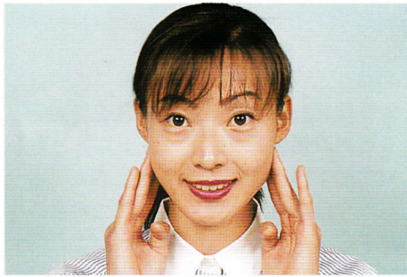
臼歯を強く咬みしめる